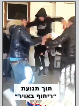
تور تنوعت "ريخوف باوير"

أصدر مستشفى "برزيلاي" تحذيراً للجمهور بعد تسجيل ارتفاع بأعداد الأولاد وأبناء الشبيبة المصابين بسبب "تحدي تيك توك" وصفه المستشفى بالخطير. وجاء في بيان صادر عن المستشفى وصلت لصحيفة بانوراما نسخة عنه "أنه تم في