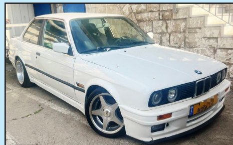
صورة متداولة تم نشرها حسب البند 27 من قانون حقوق النشر

أعلنت الشرطة أنها أوقفت سائقاً من سكان الرينة يبلغ من العمر 32 عاماً، بعد نشره مقطع فيديو على شبكات التواصل الاجتماعي يوثق قيادة متهوره وخطرة داخل البلدة، شملت تنفيذ " دريفتات " وفتح أبواب المركبة أثناء السير، ما عرّض مستخدمي الطريق للخطر. ووفق الشرطة، فإن المقطع الذي تم تداوله أظهر قيادة خطيرة بسيارة قديمة لمواطن من الناصرة، تم تعديلها بشكل مخالف للقانون. وأضافت أن قوات من المنطقة الشمالية باشرت تحقيقاً سريعاً، تمكنت خلاله من تحديد هوية السائق، حيث تم توقيفه للتحقيق، كما تم حجز مركبته وإخراجها عن الطريق بعد ثبوت مخالفات وتعديلات هيكلية غير قانونية.