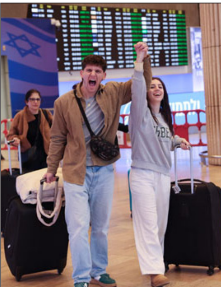
هبوط أول رحلتين لإجلاء الإسرائيليين في مطار بن غوريون لأول مرة منذ اندلاع الحرب

خففت الجبهة الداخلية القيود التي فرضت منذ اندلاع الحرب، اعتباراً من الساعة 12:00 ظهراً من يوم أمس الخميس، بما يشمل القيود على المصالح التجارية وعلى التجمعات في شتى أرجاء البلاد. وبناء على ما ذكر فإنه يسمح بتجمع حتى 50 شخصاً شريطة أن يكونوا على مسافة قريبة بما يكفي من الملاجئ وغيرها من المناطق المحمية، مع الإبقاء على المدارس مغلقة. كما تسمح تعليمات الجبهة الداخلية الجديدة بإجراء جنازات بمشاركة حتى 20 شخصاً.