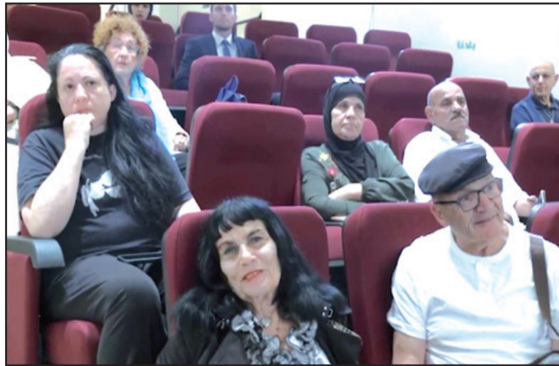
جانبا من المشاركين في اللقاء

إلى بناء الثقة في المجتمع. وأطلقنا مشروع الفسيفساء من أجل تعزيز الثقة المتبادلة في البلاد بين المجتمعين العربي واليهودي. شهدت هذه اللقاءات منذ بدايتها مشاركة المئات من الحاضرين من مختلف أنحاء البلاد. كما شملت اللقاءات شخصيات من مجالات متعددة، من بينها رجال أمن سابقين، رؤساء بلديات، ومختصين في التربية والتعليم وأكاديميين. ومضى قائلا: "نحن نرى أن الحوار بين الثقافات والأديان بات ضرورة ملحة، خاصة في ظل الأوضاع الراهنة".