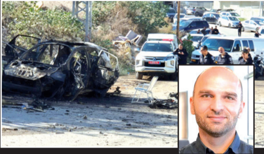
صورة من مكان انفجار السيارة في باقة الغربية