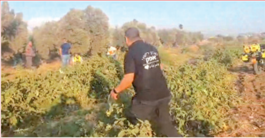
في هذا المكان - حقل الزيتون قتل شاب وامرأة بالهجوم الصاروخي قرب شارع 79 في الشمال

مقتل 7 أشخاص جرّاء هجوم صاروخي من لبنان : 5 قتلوا في المطلة وإثنان قتلوا برشقة صاروخية أخرى بحقل زيتون قرب شارع 79