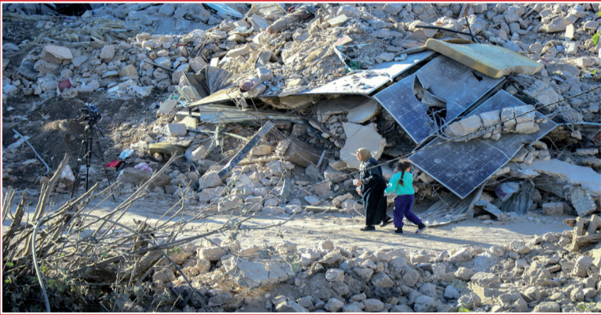
يتفقدون الدمار في موقع غارة جوية اسرائيلية بمدينة بعلبك شرق لبنان

استمرار تبادل اطلاق النار العنيف بين الجيش الاسرائيلي وحزب الله