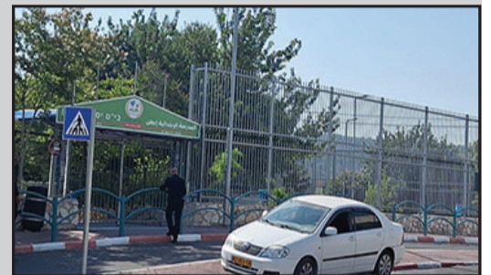
صورة عممتها لجنة اولياء امور الطلاب في مدرسة ابطن الابتدائية