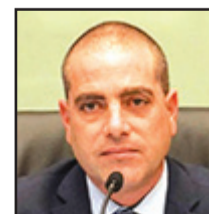
أوفير كاتس

التعليم العالي. وقال كاتس، ان " مشروع قانون ' إخراج الإرهاب من الأكاديمية ' تم تقديمه بعد تصريحات تحريضية من قبل محاضرين في مختلف المؤسسات الأكاديمية، والتي تزايدت منذ أحداث السابع من أكتوبر، واندلاع الحرب " . وأضاف رئيس الائتلاف، انه " في بعض الأحيان، تكون التصريحات التحريضية مدعومة من قبل المؤسسات نفسها " . ومضى كاتس قائلاً : " لن نسمح للإرهاب بالسيطرة على الأكاديمية في دولة إسرائيل تحت غطاء حرية التعبير. لن نسمح بالتصريحات التي تدعم الإرهاب والروح الداعمة للأنشطة ضد إسرائيل " .