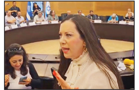
غوتليب خلال جلسة في الكنيست

وأفادت القناة العبرية، بان غوتليب " نشرت في يناير / كانون الثاني معلومات كاذبة على شبكات التواصل الاجتماعي، كشفت فيها عن هوية زوج بريسلر كعضو في " الشاباك " : " عدنا كرنفال أعلنت أن الولايات المتحدة