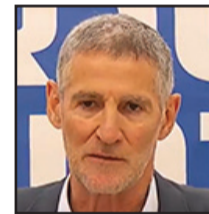
يائير جولان

هذه الحكومة الفاشلة، والأخطر منذ قيام الدولة. يكفي " . كما قال جولان في كلمته : " هذه أسوأ حكومة في تاريخ دولة إسرائيل، ولا يعقل انه في فترة الحرب، بحيث تلحق بنا خسائر كبيرة، تقوم الحكومة بتشجيع التهرب من الخدمة العسكرية. هذه الحكومة لا يمكنها ان تسدي النصائح لمن تجندوا من أجل حماية الدولة " . وعن رؤيته السياسية للفترة المقبلة، قال جولان : " نحن مصممون على إقامة اطار سياسي ليبرالي ديمقراطي، بحيث يكون هذا الاطار بديلاً حقيقياً لا يتأثر بجهاز التحريض والتفريق " .