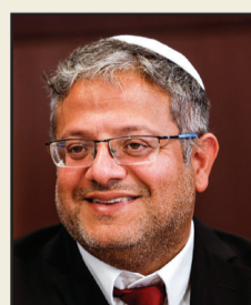
الوزير ايتمار بن غفير