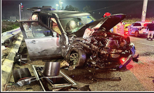
تصوير مركز البيان الطبي