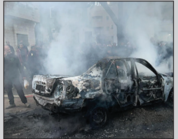
تصوير نجمة داود الحمراء