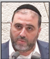
موشيه أربيل - تصوير الكنيست - صورة من الفيديو

قال وزير الداخلية موشيه أربيل " أن مسلحي حركة حماس لم يفرقوا بين عربي ويهودي حينما نفذوا الهجوم على منطقة غلاف غزة، يوم السابع من أكتوبر الماضي. " جاءت أقوال الوزير أربيل هذه في سياق رده أمام الهيئة العامة للكنيست، أول أمس الأربعاء، على استجواب مستعجل بخصوص الاستعداد لجلب عمال أجانب بدلاً من العمال الفلسطينيين. وقال الوزير أربيل: " الحرب مع حركة