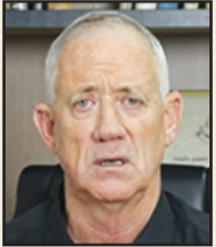
بينى غانتس - صورة من الفيديو - تصوير مكتب غانتس

رئيس حزب "همحني هممختي" الوزير بيني غانتس : "المواطنون العرب في إسرائيل هم جزء لا يتجزأ من المجتمع الإسرائيلي.. السابع من أكتوبر كان يوماً أسود علينا جميعاً"