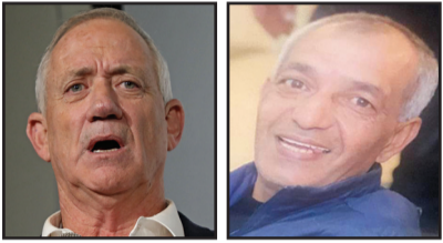
بينى غانتس

● بيني غانتس يهاجم الحكومة: " فشل ذريع - يجب اقالة بن غفير فوراً "