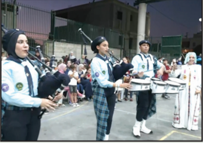
صورة من الاحتفال بالمولد النبوي في باقة الغربية

احتضن ملعب حي الشقفان في باقة الغربية، يوم الاثنين، حفلاً بمشاركة عدد كبير من الأهالي، بمناسبة حلول ذكرى المولد النبوي الشريف، وذلك بمبادرة من لجنة الحي والمركز الجماهيري وبلدية باقة الغربية. تخلل الحفل العديد من الفقرات، من بينها عرض كسفي، وأناشيد دينية، وزاوية خاصة لتفعيل الأطفال، فيما حل ضيفاً على الحفل الشيخ الدكتور محمد سلامة حسن من المشهد.