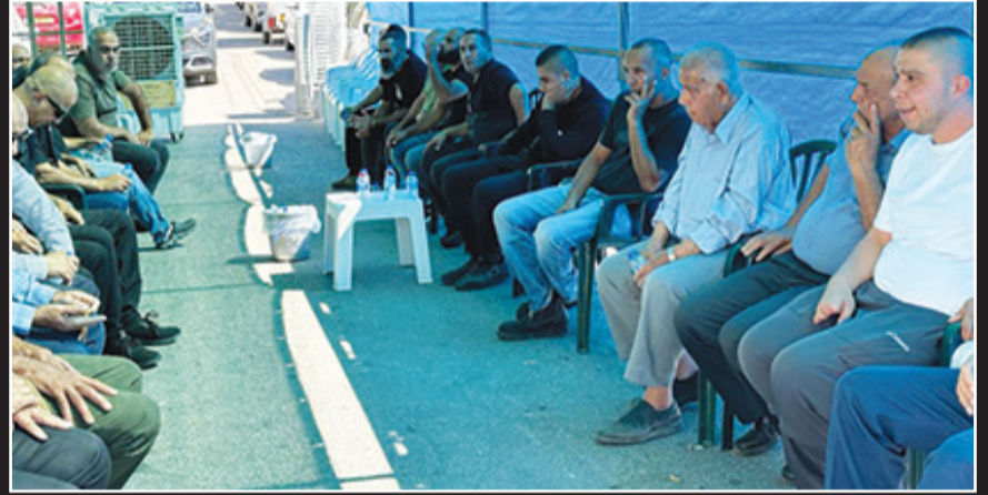
خيمة العزاء في بسمه طبعون