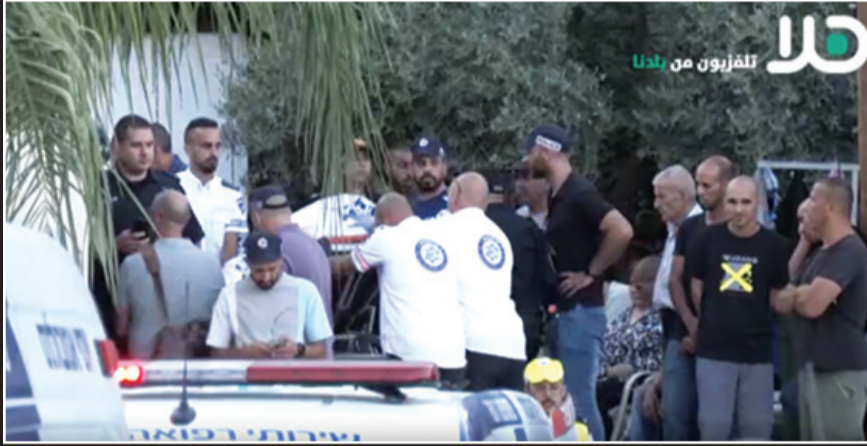
خلال نقل جثث الضحايا الى سيارات الاسعاف

● اعلان الاضراب الشامل والحداد لمدة 3 أيام ● في خطوة استثنائية : السماح للشرطة باستخدام برنامج تجسس للوصول الى منفذي المجزرة في بسمه طبعون ● النائب منصور عباس في مكان الجريمة : " هذه المجزرة هي وصمة عار على جبين حكومة إسرائيل "