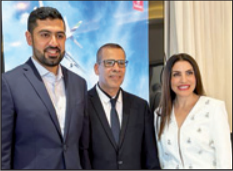
خلال المؤتمر الصحفي في حيفا