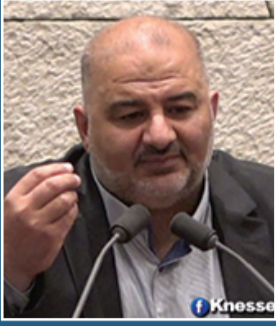
د. منصور عباس - - صورة من الفيديو