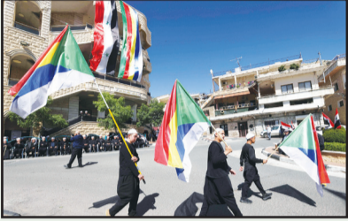
جولانيون يشاركون في إحياء ذكرى جلاء المستعمر الفرنسي عن سوريا