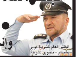
المفتش العام للشرطة كوبي شتاي

الطالب الجامعي من سالم الذي فقد بصره بالانفجار قرب مجيدو يتحدث لبانوراما: