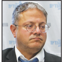
ايتمار بن غفير

الكنيست تصادق على القانون الذي يسمح بالبحث عن أسلحة بدون أمر تفتيش من المحكمة ص 5