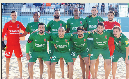
فريق فلطة ابناء كفر قاسم