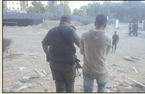
خلال اعتقال احد المشتبه بهم