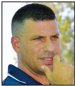
المدرّب العاد بؤورون هبوعيل اكسال