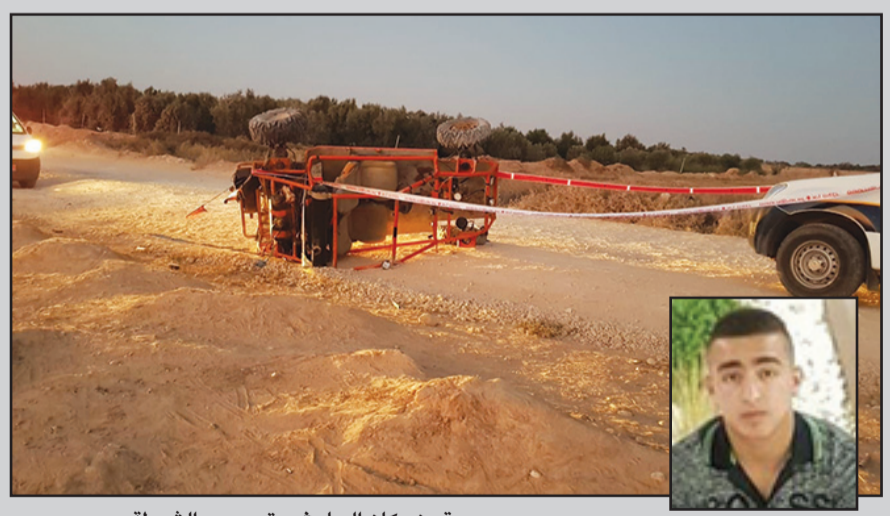
صورة من مكان الحادث