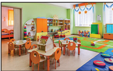
صورة للتوضيح فقط

رائدة مسؤولة عن عقودروضات "بستان وروضة الاستقبل " وملازمة الصفوف للقرن الواحد والعشرين إذ سيتم في كل عام ملازمة نحو 200 روضة بمبلغ 150 ألف شيقبل لكل روضة، والاهتمام بالنوويديت بعد الظهور وتقديم وجبة ساخنة لطلاب الصفوف الأولى – الثانية، واقامة مدرسة الاعياد ( من الروضة لغاية الصف الثالث )، وتخصيص ملف برامج لكل مرتبة أطفال وغيرها من البرامج لتعزيز ودعم جيل الطفولة المبكرة، والتي جانب كل هذه المبادرات تستعد الوزارة لتطبيق قانون التعليم الخاص " .