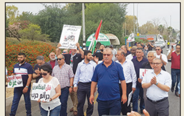
يرفعون اللافتات قرب حاجز "ايرز"