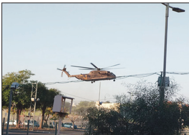
مروحية عسكرية في مكان الحادث