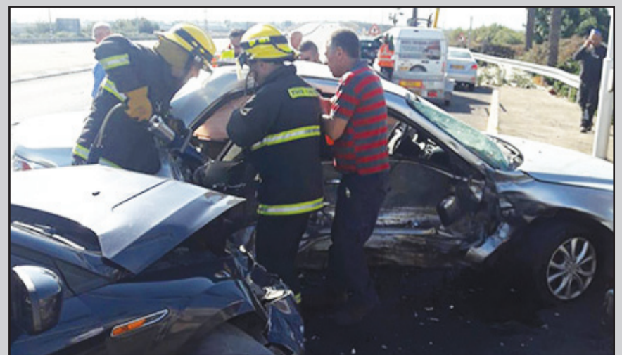
هكذا بدا منظر السيارة في مكان الحادث

داود الحمراء تلقى بلاغا عن الحادث ، حيث هرع الطواقم الى مكان الحادث وقدمت العلاج الأولي لستة مصابين وصفت جراح اثنين منهم بالخطيرة فيما وصفت جراح الأربعة الآخرين بالمتوسطة . وقد أعلن مستشفى الجليل الغربي عن وفاة السيدة من كفرمندا متأثرة بجراحها البالغة ، حيث توفيت خلال عملية طارئة اجريت لها .