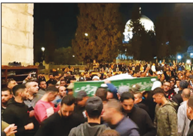
خلال تشيع الجثامين من المسجد الأقصى

وقالت مصادر طبية أن " الشاب نقل بسيارة الاسعاف وهو فاقد للوعي وحالته بالغة الخطورة ، لمستشفى سوروكا في بئر السبع ، وهناك تم اعلان وفاته " . من جانبها ، باشرت الشرطة التحقيق في ملابس الحادثة .