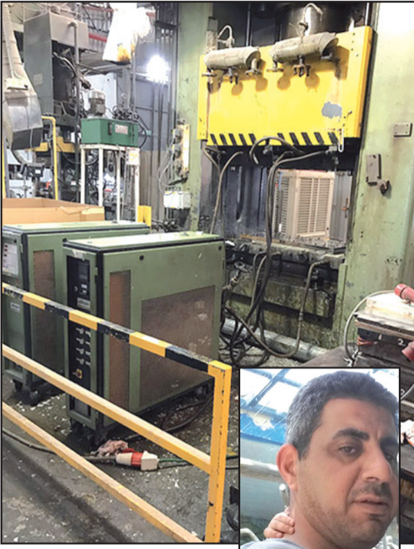
صورة من مكان الحادث