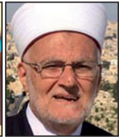
الشيخ عكرمة صبري