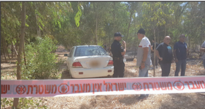
رجال شرطة في مكان العثور على الجثة

احراش في " تل عدسيم " القريبة من الناصرة ، عثرت خلال اخماد الحريق على جثة المرأة بجانب مركبة مركونة هناك .