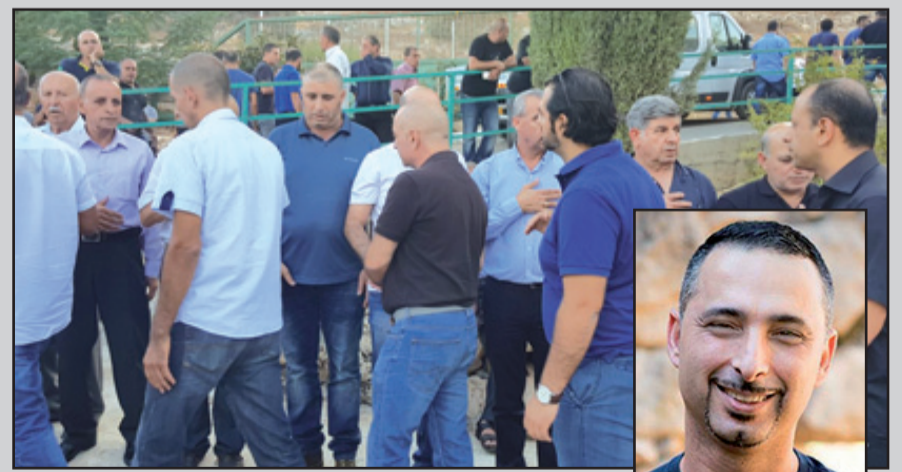
يقدمون العزاء لعائلة الفقيد في مجد الكروم