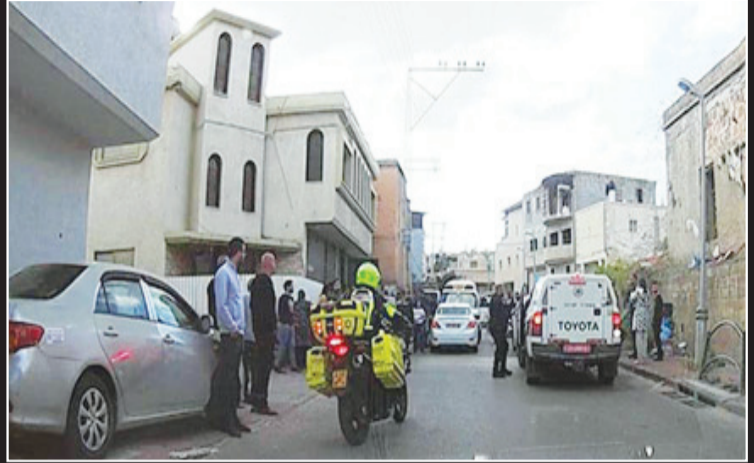
صورة من مكان اطلاق النار - تصوير سعيد مطر - نجمة داود الحمراء

ولد عمره 12 سنة مصاب بالتوحد كان يظل رايح جاي عند امه في الساعة الاخيرة قبل مقتلها، اول ما سمع الطلق نزل عند امه، وشافها مقتولة ". وتابع منصور: " احنا ناس مستورين ما بنيجي بحد، كان لدينا الكثير من التخطيطات، الفترة الاخيرة كانت اجمل فترة في تاريخ حياتنا، صارلنا متزوجين 20 سنة وهذه احسن فترة نمر بها " .