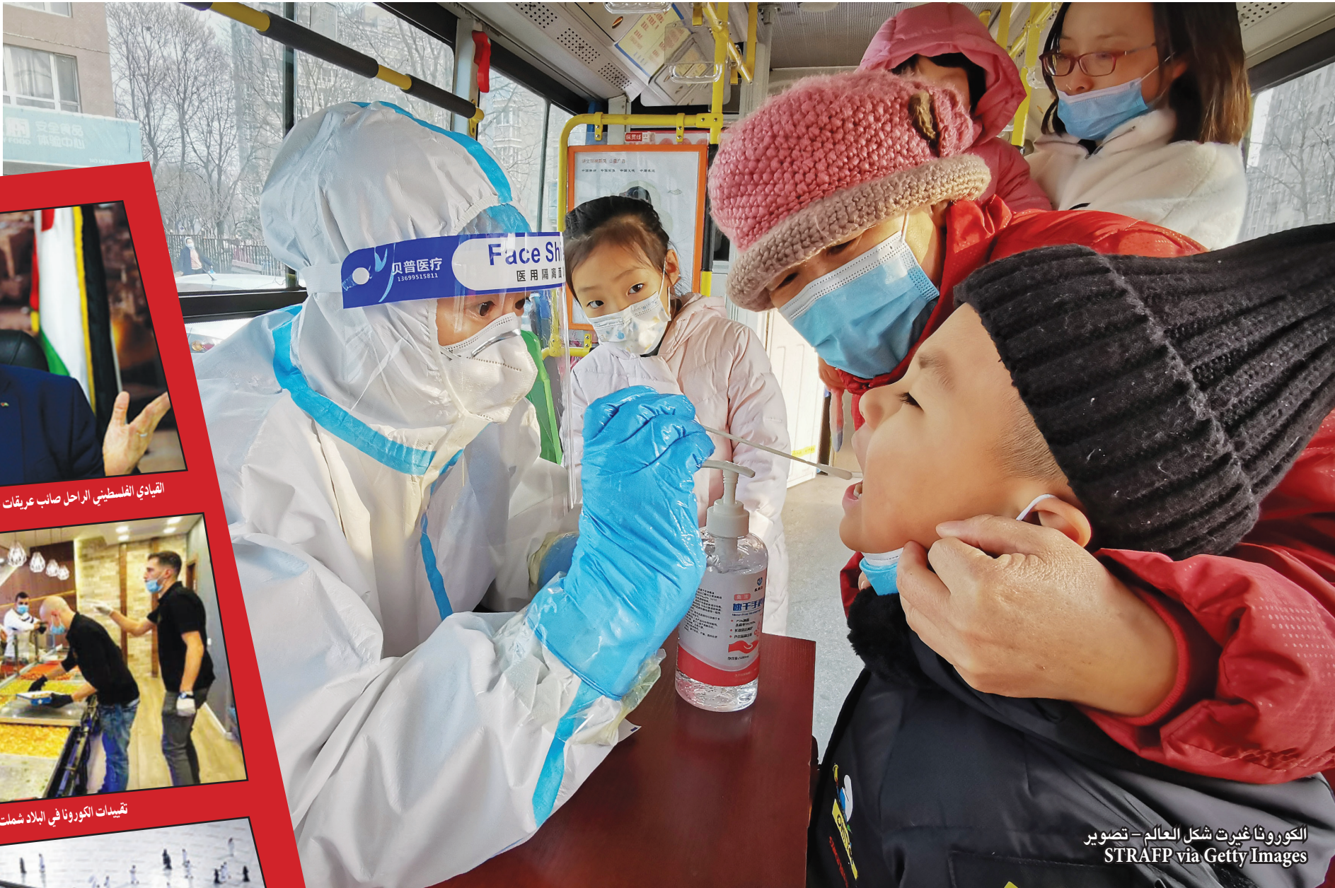
الكورونا غيرت شكل العالم

قاسم سليمان، و بجانبه أبو مهدي المهندس نائب قائد ميليشيات الحشد الشعبي العراقية الموالية ل طهران.