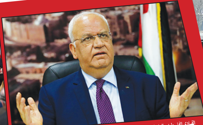
القيادي الفلسطيني الراحل صائب عريقات