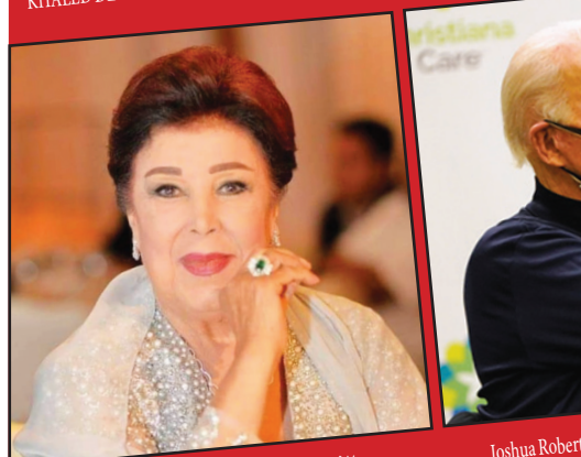
الفنانة الراحلة رجا الجداوي

جولة انتخابية جديدة هي الرابعة في غضون أقل من عامين، حيث كان حزبا الليكود وكاحول لفان قد توصلا الى اتفاق لتشكيل حكومة على أساس اتفاق تناوب، وذلك بعد انتهاء الانتخابات الأخيرة، التي جرت بداية العام الجاري، دون حسم واضح، لكن هذه الحكومة تفككت بعد أزمنة انتلافية عديدة. – شهد المجتمع العربي هذا العام سقوط عدد كبير من ضحايا الجريمة والعنف، بلغ حتى ساعة إغلاق هذا العدد 110 قتلى، من بينهم شباب ورجال، نساء وأمهات، وقد توالى دعوات القيادات العربية الى وقف شلال الدم، حيث نظمت لجنة المتابعة، مطلع الأسبوع، مظاهرة سيارات انتهت بوقفة احتجاجية أمام مبنى الكنيست. – الأزمة في القائمة المشتركة: بلغت الخلافات في القائمة المشتركة ذروتها، في الشهرين الأخيرين، والتي تمثلت بشرح كبير بين نواب القائمة العربية الموحدة ورئيسها عضو الكنيست، منصور عباس، وبين باقي مركبات القائمة: الجبهة، التجمع والعربية للتغيير، بسبب موقف نواب القائمة الموحدة " الحركة الاسلامية " من قضية التعامل مع رئيس الحكومة بنيامين نتانياهو.