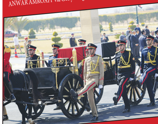
تسليم جنرال حسني مبارك بجنازة عسكرية في القاهرة