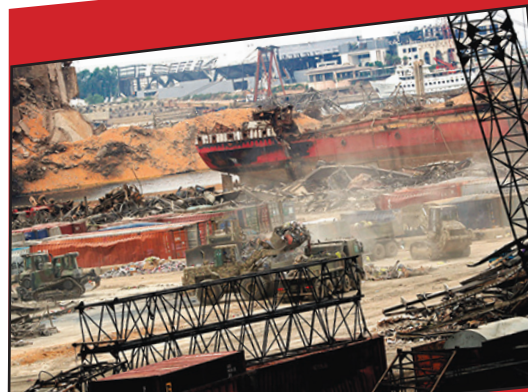
دمار كبير خلفه انفجار مرفأ بيروت

— مع حل الكنيست، في الأيام الأخيرة، دخلت البلاد إلى