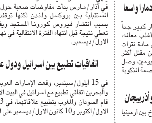
فيضانات في السودان

قاعدتين جويتين في أربيل وعين الأسد، غرب بغداد. أما يوم 8 كانون الأول/يناير، فقد لقي أكثر من 170 شخصاً مصرعهم في تحطم طائرة بوينغ 737 تابعة للخطوط الجوية الأوكرانية بعيد إقلاعها من طهران إلى كييف، واعترف بعدها الحرس الثوري الإيراني أنه أسقط بطريق الخطأ الطائرة بعد فترة وجيزة من إقلاعها، معتقداً أنها صاروخ في وقت كان فيه التوتر متصاعداً مع الولايات المتحدة، وكان كثير من ضحايا الحادث المروع مواطنين كنديين أو مقبضين دائمين.