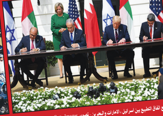
توقيع اتفاق التطبيع بين إسرائيل، الإمارات والبحرين