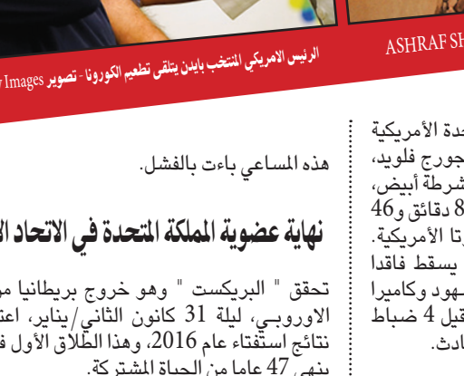
الرئيس الأمريكي المنتخب باين ينقضي تفعيم الكورونا