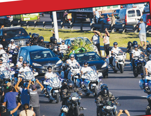
جنازة مارادونا - تصوير ( Tomas Cuesta/Getty Images )