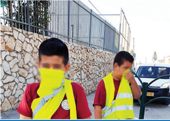
طلاب في باقة