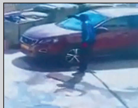
تصوير كاميرات المراقبة