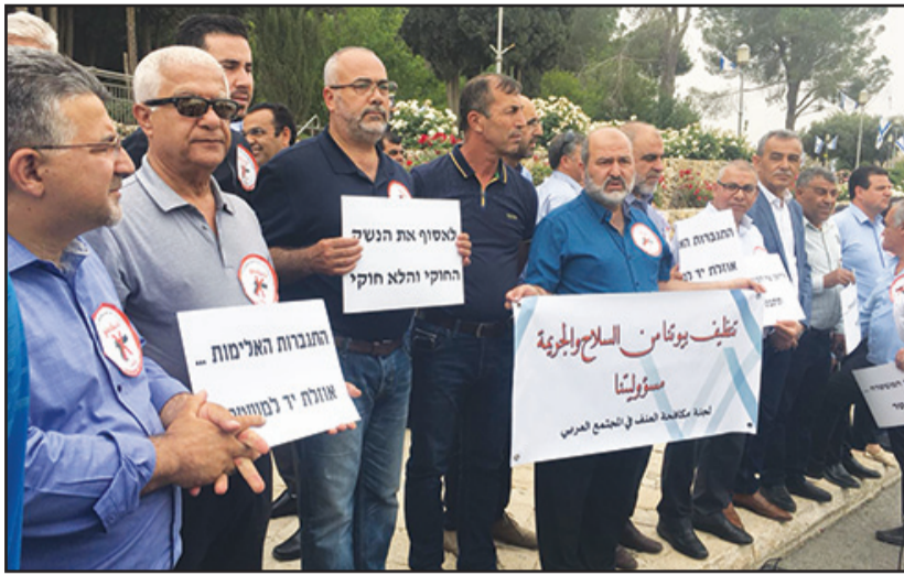
يرفعون اللافتات أمام مكتب رئيس الحكومة