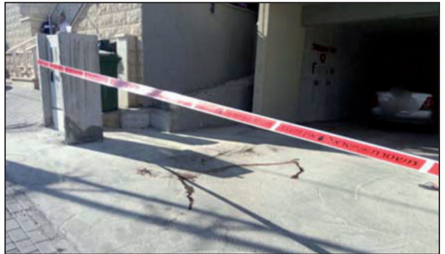
الشرطة اغلقت مكان الحادثة للتحقيق

تخله، على ما يبدو، قيام شابين من اقرباء العائلة هما في العشرينات من اعمارهما، بدهس الشاب مما تسبب باصابته بجروح بالغة الخطورة ومن ثم هربا بسيارتهما وارتما بطريقهما بسيارة اخرى وبشخصين آخرين اللذين اصيبا ايضا طفيفا.