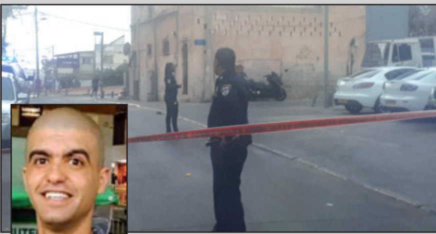
الشرطة أغلقت مكان الحادثة للتحقيق