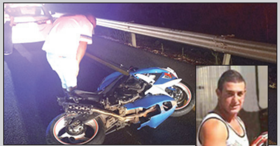
هكذا بدا منظر الدراجة النارية في مكان الحادث