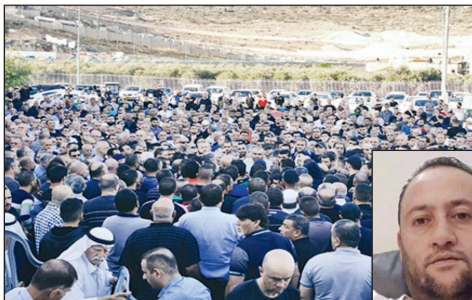
اجواء حزينة في طرعان لدى تشييع جثمان الفقيد

والبيت يتحمل مسؤولية كبيرة والمدارس ويجب عليهم احتواء الطلاب ومنع العنف. واحدى طرق العلاج لاي قضية هي معرفة الواقع وهذا واقع مؤسف جداً، لكن