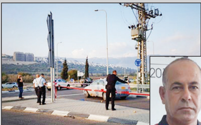
صورة من مكان اطلاق النار