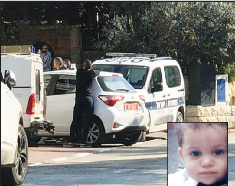
سيارات شرطة في مكان الحادث