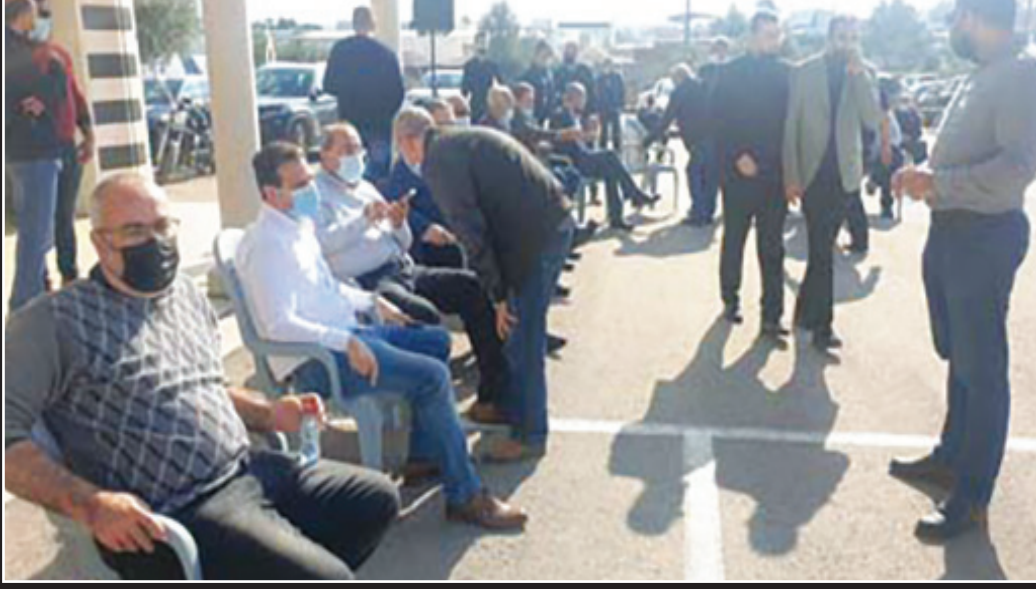
جانب من الحضور في الاجتماع الطارئ في باقة الغربية