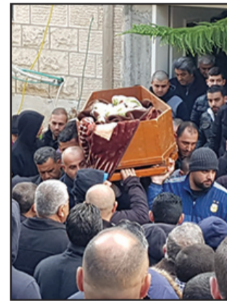
أجواء حزينة خلال تشييع الجثمان