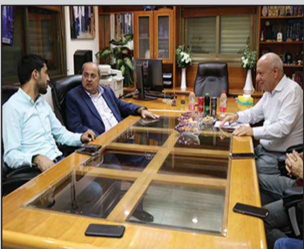
صورة التقطت خلال الزيارة