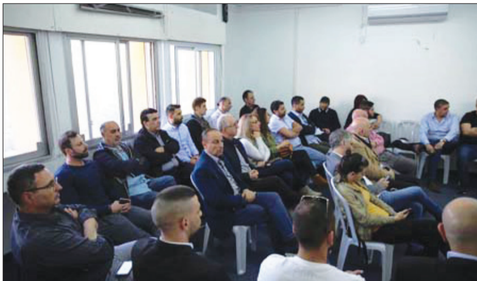
جانب من الحضور في الاجتماع