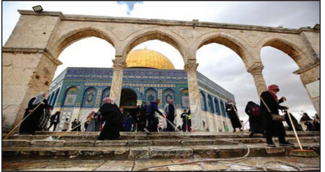
متطوعات ينظفن باحات المسجد الأقصى

العربية الموحدة، وتولى عرافته غازي عيسى. وأثنى الشيخ عمر الكسواني على الجهود الدائمة التي تقوم بها جمعية الأقصى طوال العام لدعم المسجد الأقصى المبارك والأهل في القدس، وخاصة في هذا المعسكر السنوي. وأكد الشيخ حماد أبو دعابس في كلمته على "أن الحركة الإسلامية وأهلنا في الداخل الفلسطيني سيقفون على العهد مع المسجد الأقصى المبارك ومع أهالي القدس تمكيناً وتثبيتاً ودعمًا لصمودهم".