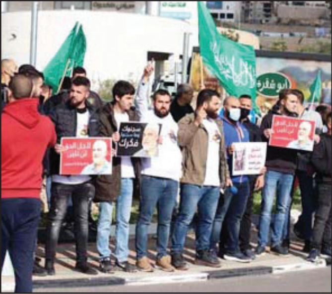
جانب من المشاركين بالوقف التضامنية