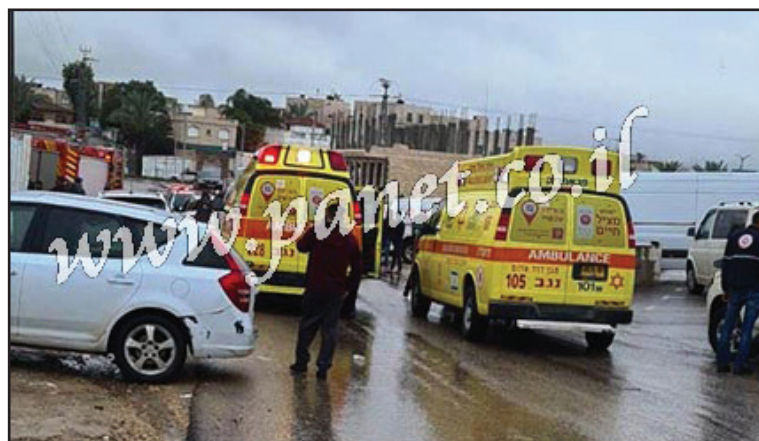
سيارات اسعاف في رهط

لمعطيات فقد تم تخليص الرضية قبل وصول طواقم الإطفاء. وعملت الطواقم على اخماد النيران وإخراج الدخان الكثيف من المنزل. ويجري تحقيق لمعرفة أسباب اندلاع الحريق.