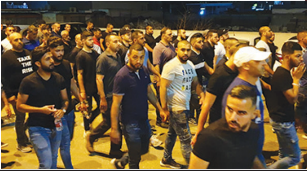
أجواء حزينة خلال تشييع جثمانى الشقيقين