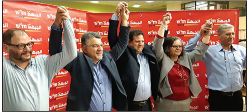
خلال المؤتمر في شفاعمرو

وقال عضو الكنيست أيمن عودة بكلمته: " قانون القومية مرّ بـ 62 عضو كنيست، نحن بحاجة لرفع نسبة التصويت أمام قانون القومية الذي لا يعتبرنا شعبا، هل يجب أن نتحد أم أن نذهب مشتتين؟ هذا هو أهم الأسئلة الوطنية في هذه الانتخابات. من موقعي كرئيس لقائمة الجبهة والقائمة المشتركة أتوجه للاخوة والشركاء في الحركة الاسلامية وفي التجمع الوطني الديمقراطي والاخوة في العربية والتغيير، تعالوا نتحد ونخوض الانتخابات بقائمة مشتركة. هناك استطلاع أهم من كل الاستطلاعات، منذ عام 49 فما فوق شارك الناس بالانتخابات حصلنا على أقل مقاعد كأحزاب مختلفة، مما حصلنا عليه مقاعد كقائمة مشتركة، هذا الاستطلاع الأكبر وهذا هو المطلوب اليوم، والجبهة اليوم أقوى من ما كانت عليه بالأمس، ونريد أن نفاوض بمسؤولية وبكرامة من أجل بناء القائمة المشتركة ". كما فاز عوفر كسييف بالمقعد الثالث بعد فوزه بـ 60% من الاصوات. وافاد مراسل صحيفة بانوراما أن يوسف جبارين فاز بالمقعد الرابع بعد انسحاب جميع المرشحين على المقعد الرابع، كما فاز جابر عسائلة بالمقعد الخامس بعد فوزه بنسبة 59% من الاصوات في انتخابات الجبهة.