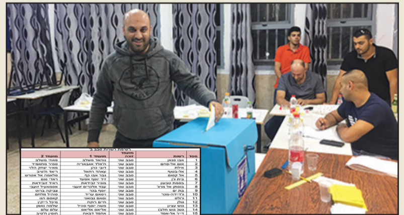
شاب يدلي بصوته في الجولة الاولى في قلنسوة