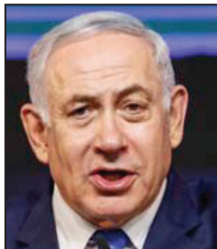
بنيامين نتنياهو

مع اختتام جولة أخرى من المفاوضات بين حزبي "كحول لفان" و "الليكود" ، مساء امس الأول الأربعاء، بقيت احتمالات تشكيل حكومة وحدة وطنية معلقة، إذ لا نتائج ملموسة على الأرض. كما أكد الحزبان ان الفجوة بينهما واسعة.