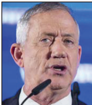
بيني غانتس

الطبيبي : هناك امكانيات كبيرة لاجراء انتخابات ثالثة ، اللهم الا اذا غير احد اللاعبين الاساسيين موقفه ووعوده للجمهور مثل ليبرمان مثلا .